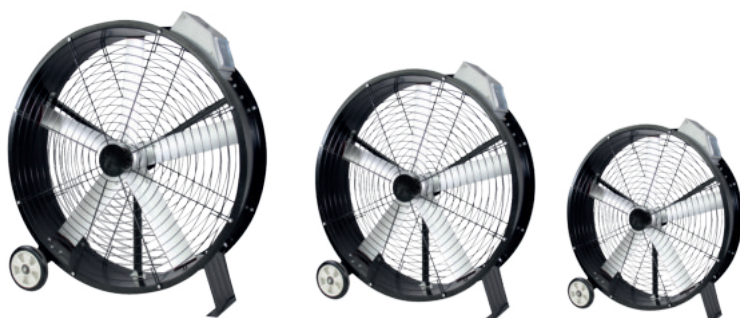
Disponible en 3 diámetros